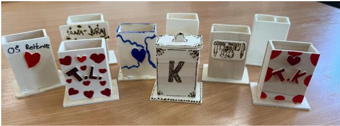
Slika 3: Stalci za olovke