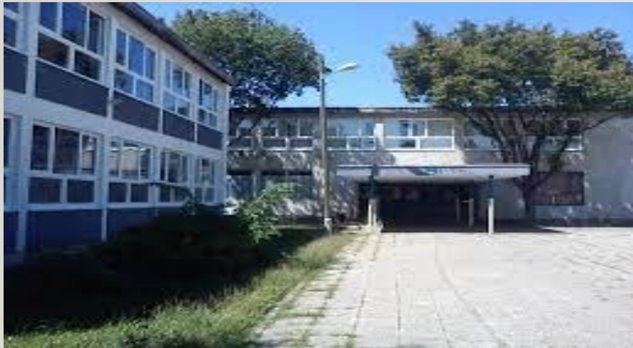
OŠ Marije Jurić Zagorke, Zagreb