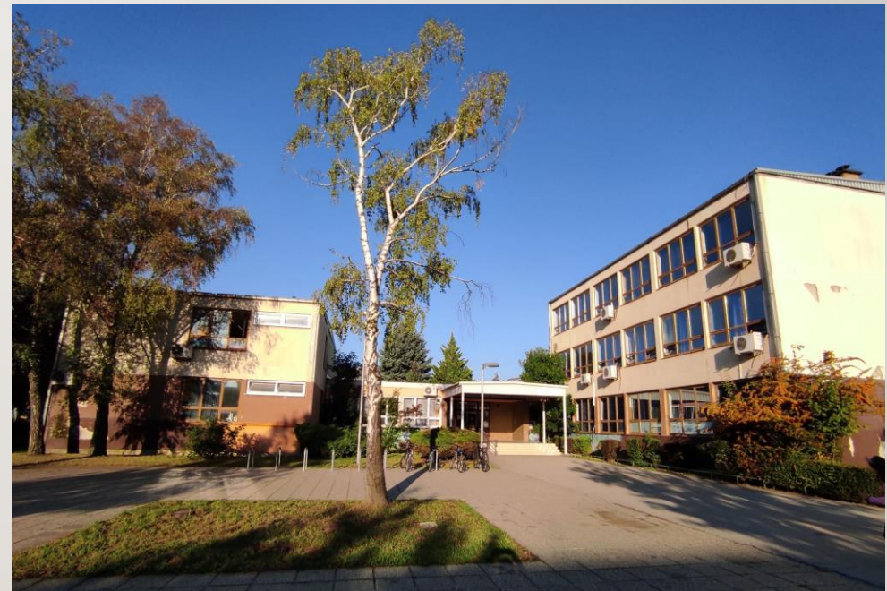
OŠ Retkovec, Zagreb