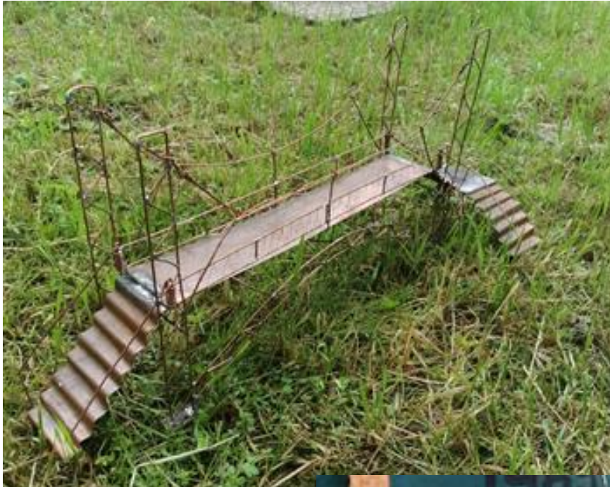
Slika 1: BAKRENI MOST