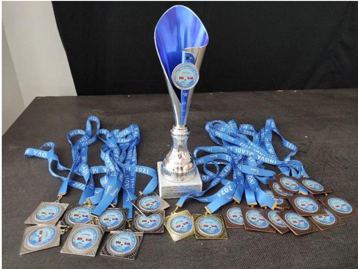
Slika 13: Nagrade: 2 zlatne, 8 srebrnih i 11 brončanih medalja i Pokal za najbolju osnovnu školu