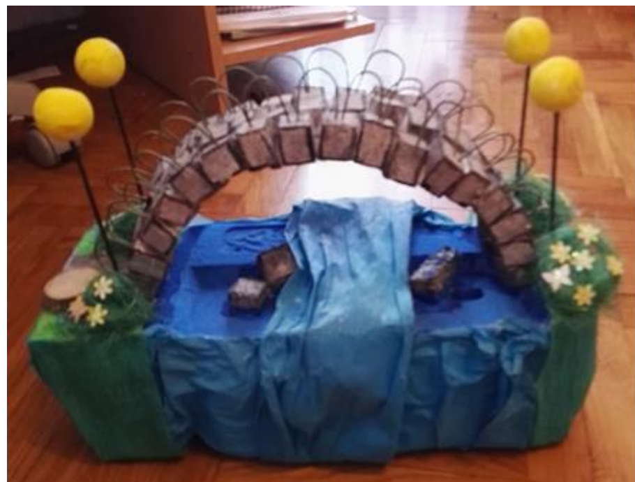
Slika 9: VESELI MOST