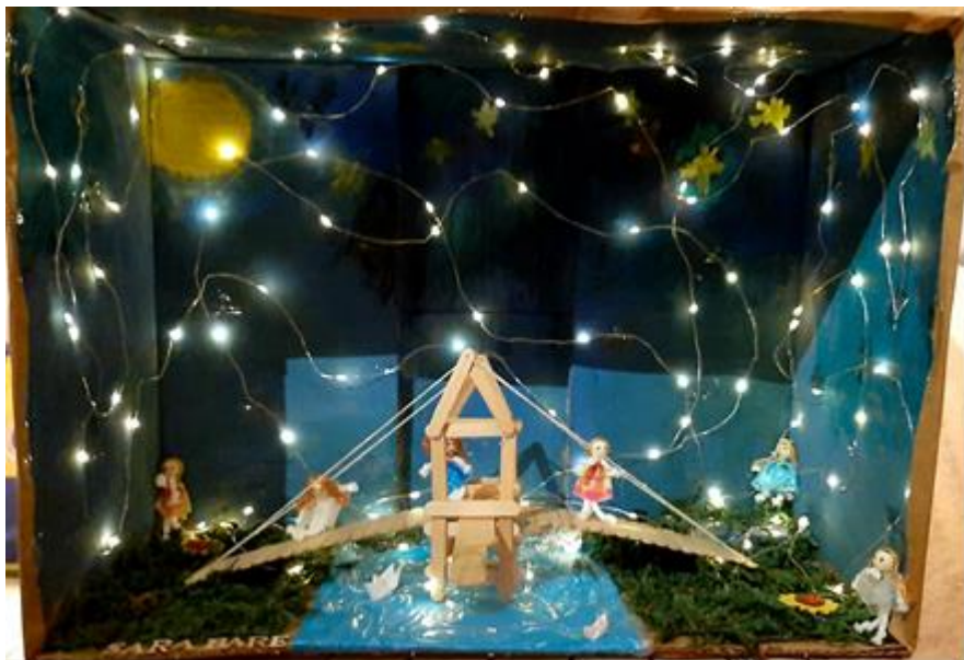
Slika 4: VILINSKI MOST