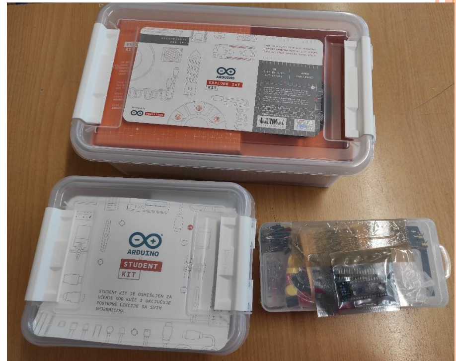
Slika 21: Nagrada