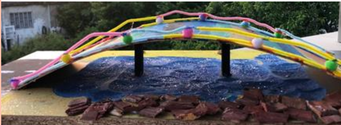
Slika 10: MOST PRIJATELJSTVA