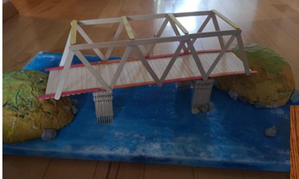
Slika 7: ĐURIN MOST