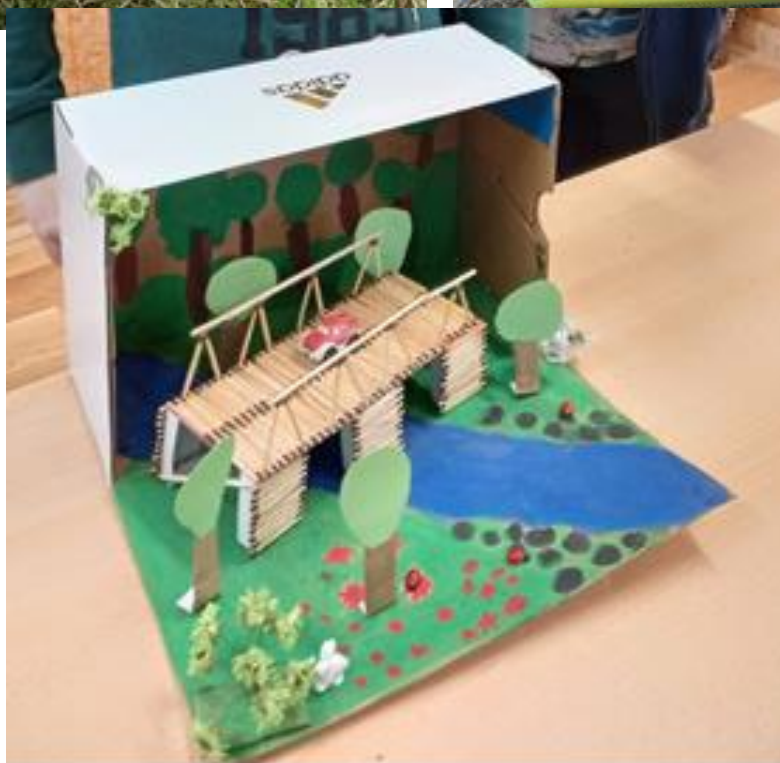
Slika 3: BRATSKI MOST