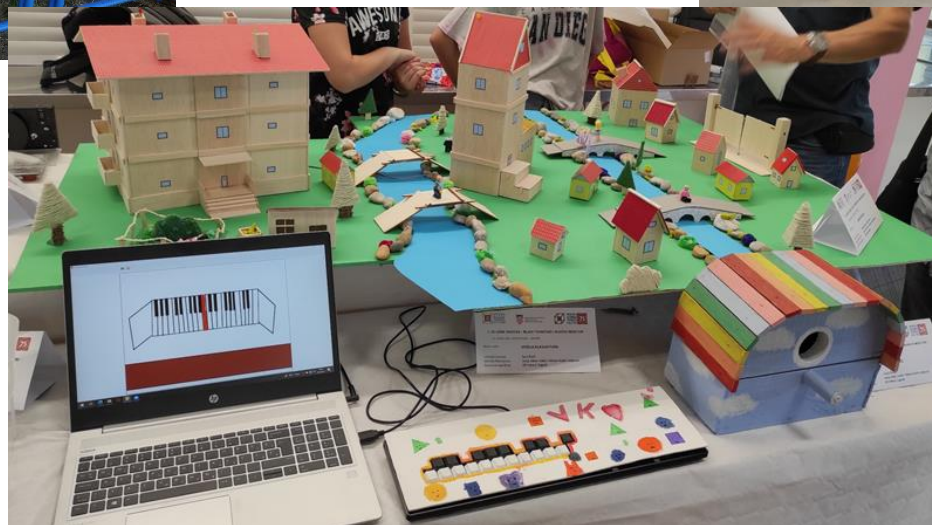
Slika 14.15.16.: Izloženi radovi na smotri