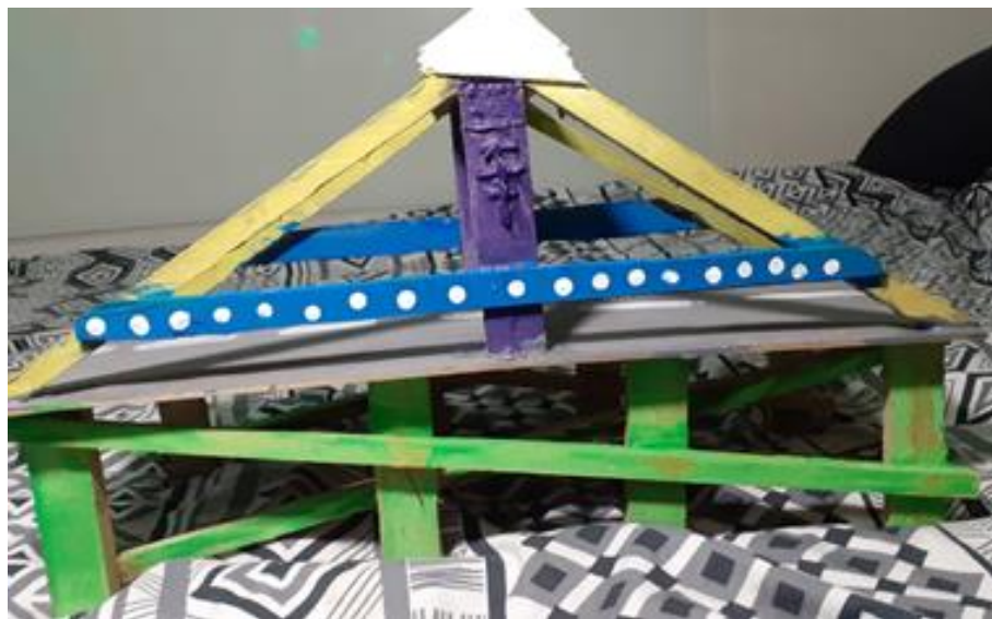
Slika 6: DUGIN MOST