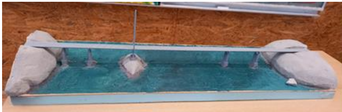
Slika 12: VELIČANSTVENI MOST