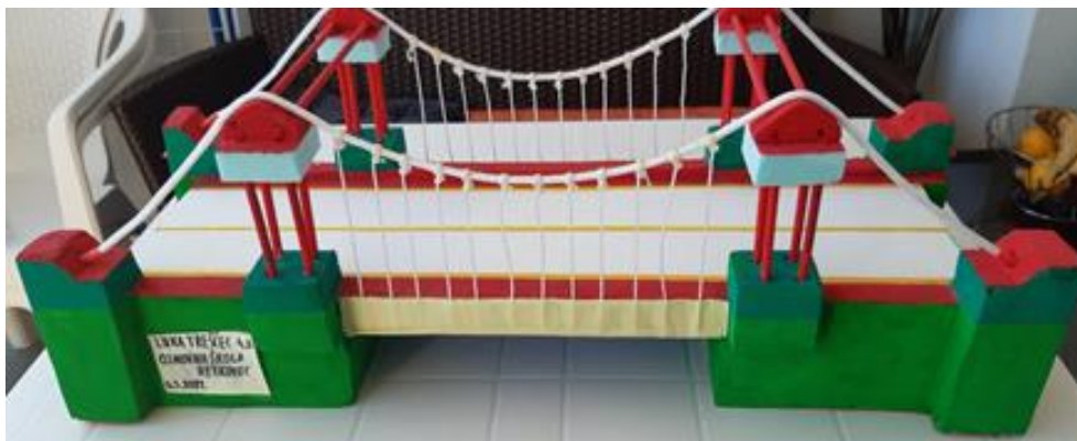
Slika 11: VELIČANSTVENI MOST