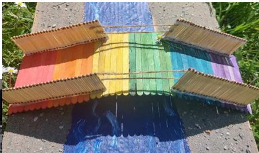
Slika 5: ŠARENI MOST