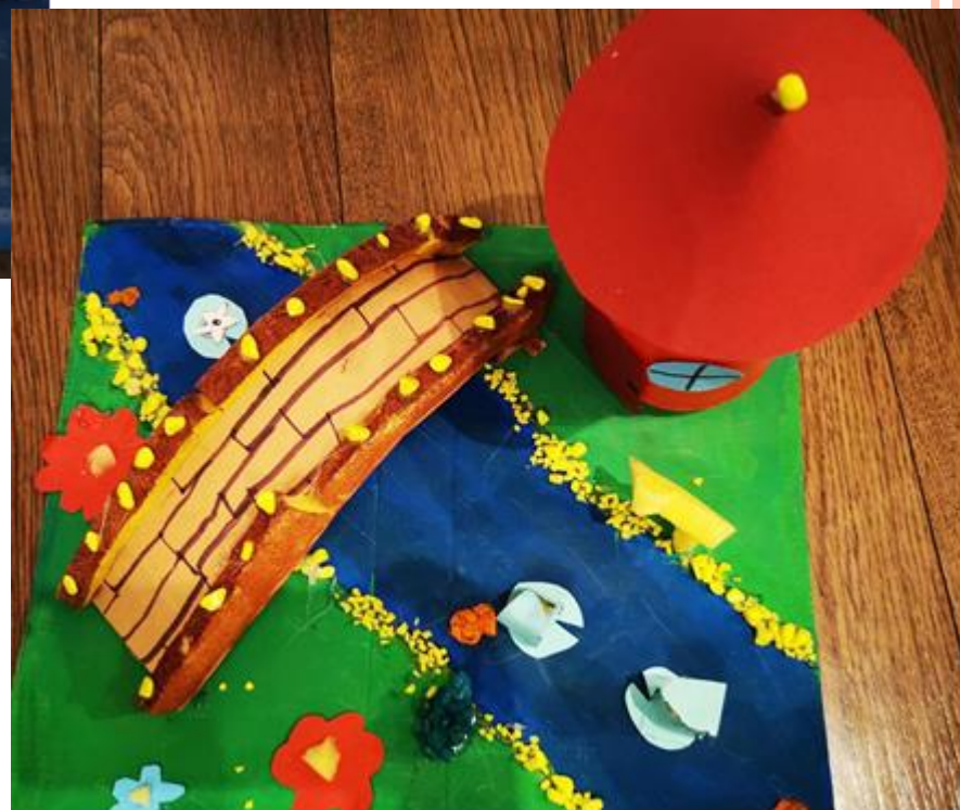
Slika 8: KINESKI MOST