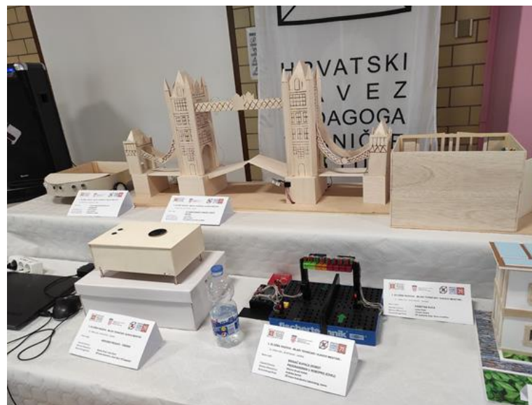
Slika 17.18.19.20.: Izloženi radovi na smotri